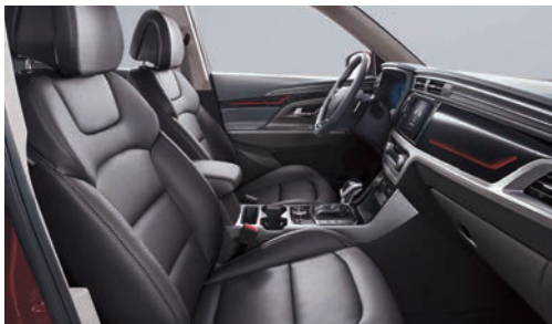
Černý interiér (LBH)