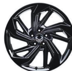
19" černé ALU kola „Diamond Cutting“, pneumatiky 235/50 R19