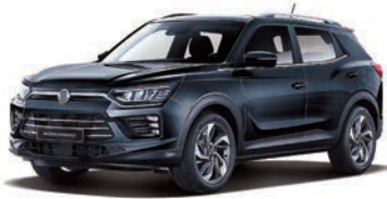
SPACE černá (LAK)