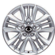
17" ALU kola, pneumatiky 225/60 R17