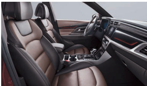
Hnědý kožený paket (OAY)