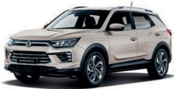
LATTE béžová (EBL)