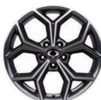
18" ALU kola „Diamond Cutting“, pneumatiky 235/55 R18