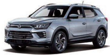
IRON kovová (ADE)