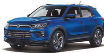
DANDY modrá (BAS)