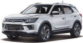
GRAND bílá (WAA)