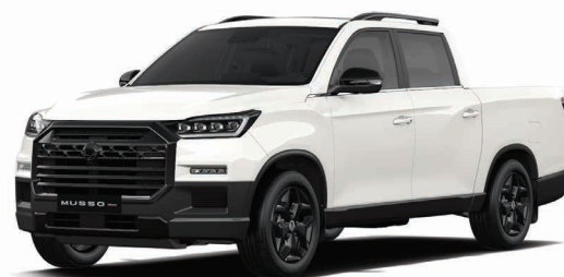
Základní barva GRAND bílá (WAA) s BLACK paketem