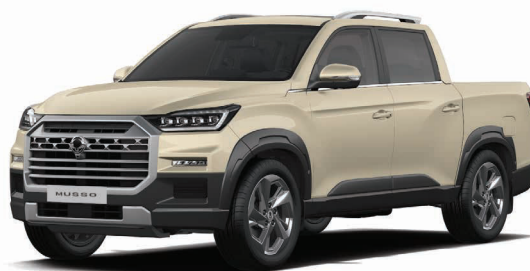
Metalická barva SAND béžová (EBK)