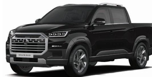
Metalická barva SPACE černá (LAK)