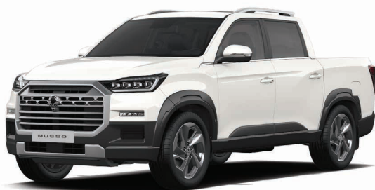
Základní barva GRAND bílá (WAA)