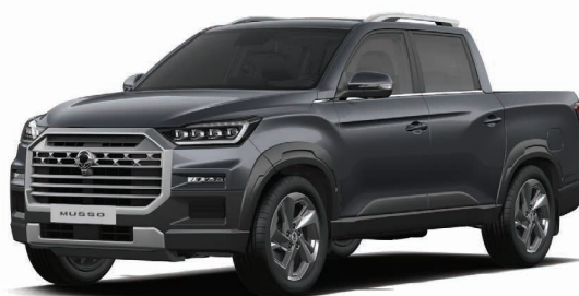
Metalická barva MARBLE grafitová (ACM)