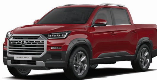
Metalická barva INDIAN červená (RAJ)