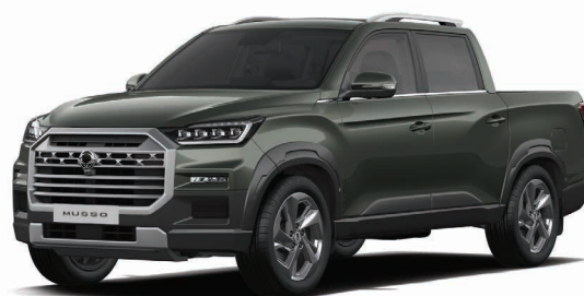
Metalická barva AMAZONIA zelená (GAM)