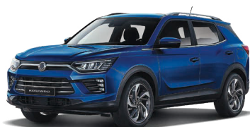
DANDY modrá (BAS)