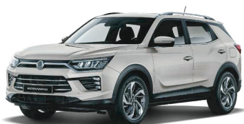
LATTE greige (EBL)