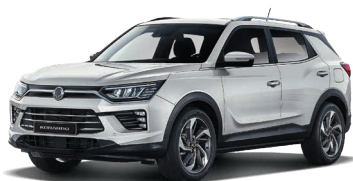
GRAND bílá (WAA)