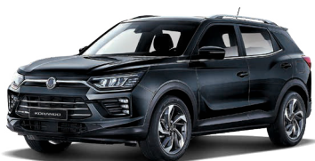
SPACE černá (LAK)