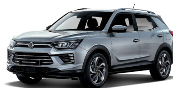
IRON kovová (ADE)