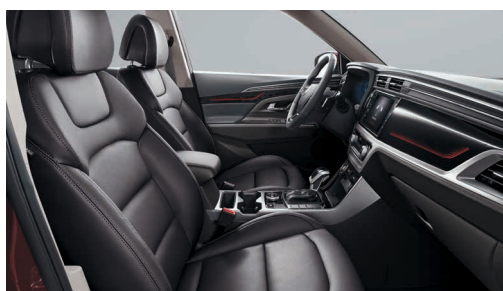
Černý interiér (LBH)