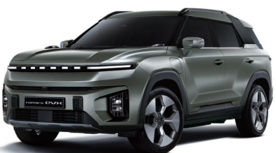
FOREST zelená (GAO)