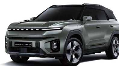
FOREST zelená s černou střechou (2GO)