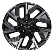
18" ALU kola "Diamond Cut"