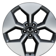
20" ALU kola "Diamond Cut"