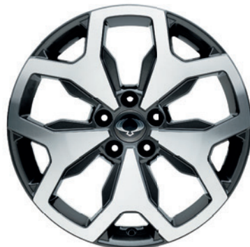
18" ALU kola "Diamond Cut", pneumatiky 235/55 R18