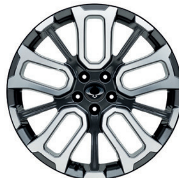
20" ALU kola "Diamond Cut", pneumatiky 245/45R R20