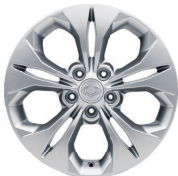
17" ALU kola, pneumatiky 225/60 R17