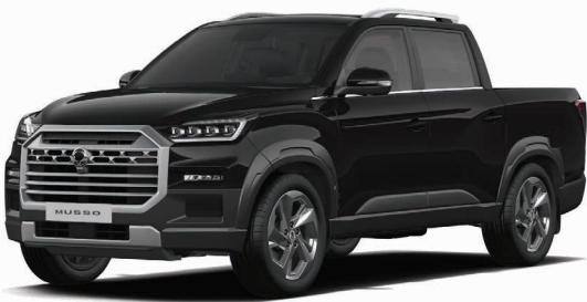
Metalická barva SPACE černá (LAK)