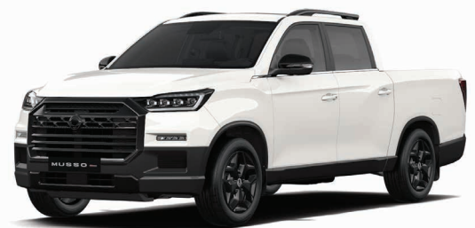
Základní barva GRAND bílá (WAA) s BLACK paketem