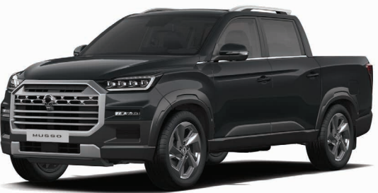
Metalická barva GALAXIES šedá (ADB)