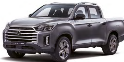
Metalická barva MARBLE grafitová (ACM)