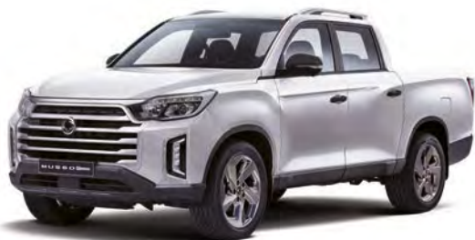
Základní barva GRAND bílá (WAA)