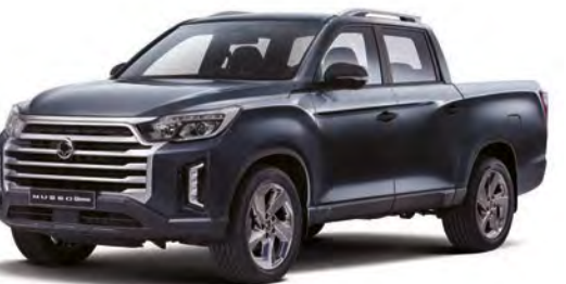
Metalická barva GALAXIES šedá (ADB)