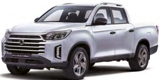
Metalická barva PEARL bílá (WAK)