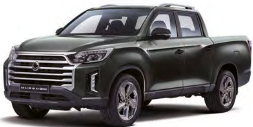
Metalická barva AMAZONIA zelená (GAM)