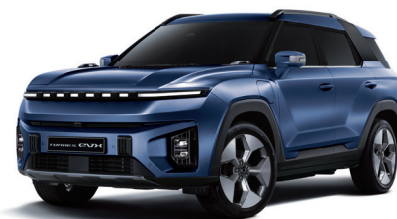
DANDY modrá (BAS)