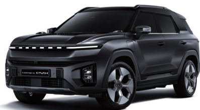
SPACE černá (LAK)