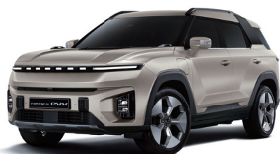
LATTE béžová (EBL)