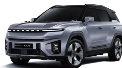
IRON kovová s černou střechou (2DE)