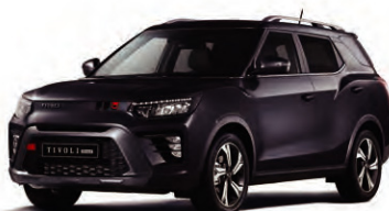
SPACE černá (LAK)