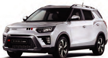
GRAND bílá (WAA)