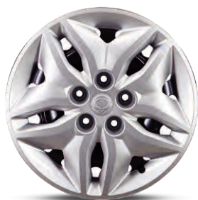
16" ocelová kola, pneumatiky 205/65 R16