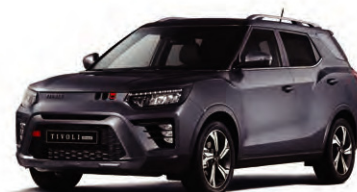
PLATINUM šedivá (ADA)