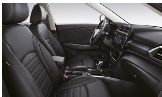
Černý interiér (LBH)*

*Foto je pouze ilustrativní, na českém trhu je v nabídce pouze textilní potah sedadel.