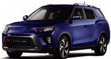
DANDY modrá (BAS)