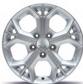
16" ALU kola, pneumatiky 205/65 R16