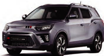
Metalická barva IRON kovová (ADE)