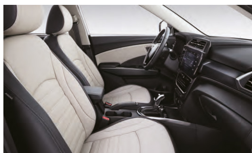
Běžový interiér (EBG)*

*Foto je pouze ilustrativní, na českém trhu je v nabídce pouze textilní potah sedadel.