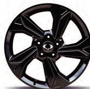
18" ALU kola Diamond Cutting - černá, pneumatiky 215/50 R18